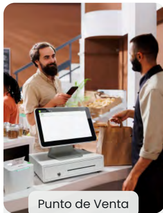
Punto de Venta

Nuestras soluciones punto de venta permiten hacer la toma de pedidos desde varios entornos.