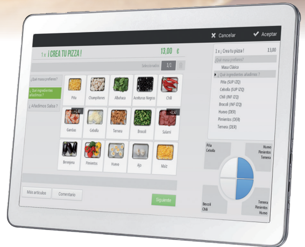
Pizza por porciones