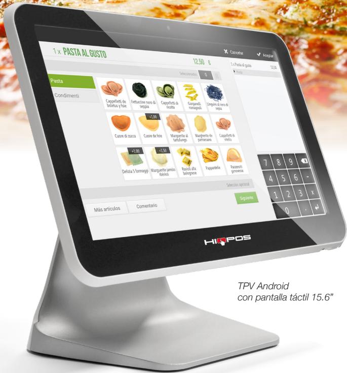
TPV Android con pantalla táctil 15.6"