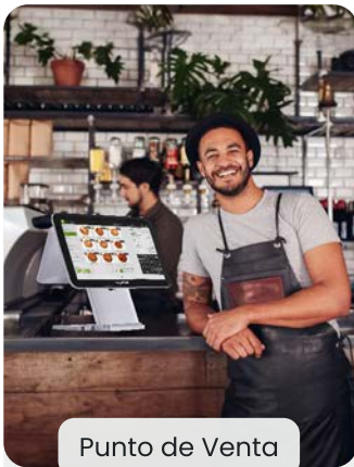
Punto de Venta

Nuestras soluciones punto de venta permiten hacer la toma de pedidos desde varios entornos.