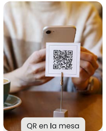
QR en la mesa